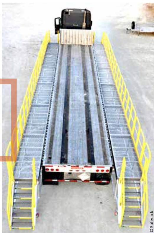
AFBEELDING 2 Mobiel loopplatform langs oplegger FIGURE 2 Plateforme de circulation mobile le long de la remorque

De oplegconstructie moet uiteraard voldoende stabiel zijn op het moment dat de vloerelementen geplaatst worden. Dat betekent dat het beton of de