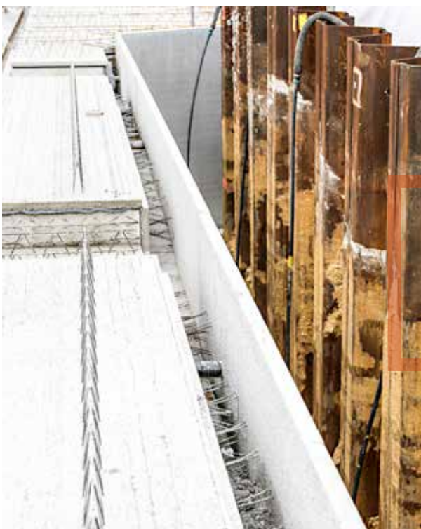
AFBEELDING 6 Verloren bekisting bij dubbele wanden FIGURE 6 Coffrage perdu sur doubles murs

Tijdens het storten van het beton met een betonneerbak, ook kubel genoemd, worden de arbeiders blootgesteld aan risico's bij het hijsen en het geleiden van de kubel. Deze risico's kunnen niet vermeden worden. Voorzichtigheid is hier de boodschap. Indien het beton gepompt wordt, kan het manoeuvreren van de giek ongevallen veroorzaken. Ook hier is extra voorzichtigheid geboden. Bij het opstarten van het pompen is het bovendien verboden zich in de gevarenzone van de einddarm te begeven. Deze veiligheidsmaatregelen zijn niet gelinkt aan het gebruik van prefab maar inherent aan het betonneren. ▶