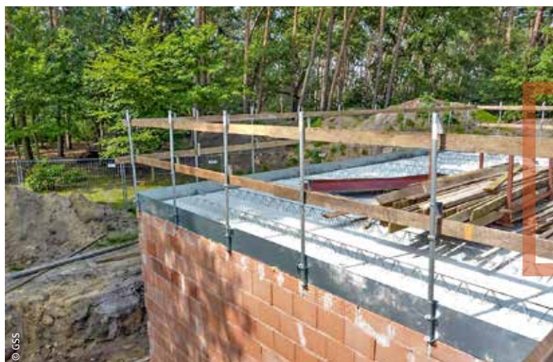
AFBEELDING 3 Randbeveiliging geïntegreerd in randbekisting

Wanneer tijdens de plaatsing blijkt dat een vloerelement te lang is, mag men het element zeker niet verder monteren. Het element moet afgevoerd worden naar een veilige plaats op de grond om het daar te corrigeren. Werden de veiligheidskettingen van de welfselklem al losgemaakt, dan moeten die eerst terug vastgemaakt worden. Indien het welfsel even wordt neergelegd op de oplegconstructie zonder de klem te verwijderen, bestaat de kans dat de klem zijn grip verliest wanneer het element terug omhoog getild wordt. In dat geval dient dus altijd gecontroleerd te worden of