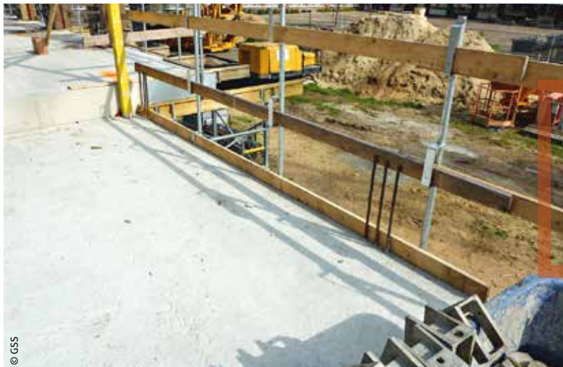
AFBEELDING 4 Randbeveiliging met kantplank FIGURE 4 Protection latérale avec plinthe

wordt in de randbekisting (Afbeelding 3). Afhankelijk van dit systeem, het type vloerelement en de oplegdetailing wordt de randbekisting aangebracht vóór of na het plaatsen van de vloerelementen. Naderhand kan de randbeveiliging eenvoudig aangebracht worden vanaf de geplaatste vloerelementen door arbeiders te voorzien van een persoonlijke valbeveiliging. Een andere oplossing bestaat erin hulzen of ankers mee te storten of te metselen in de oplegconstructie, waarin of waaraan dan later de randbeveiliging eenvoudig aangebracht kan worden. Indien gewerkt wordt met een gevelsteiger kan deze ook dienst doen als randbeveiliging, op voorwaarde dat