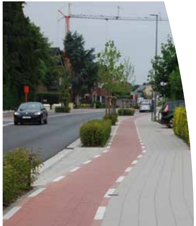
Fietspad in Middelkerke