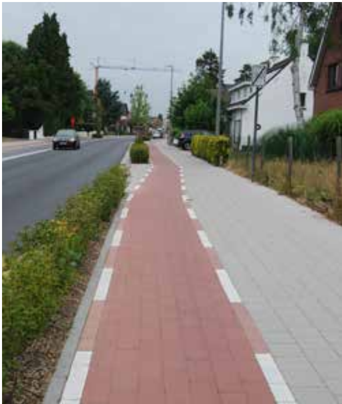
Fietspad in Zingem